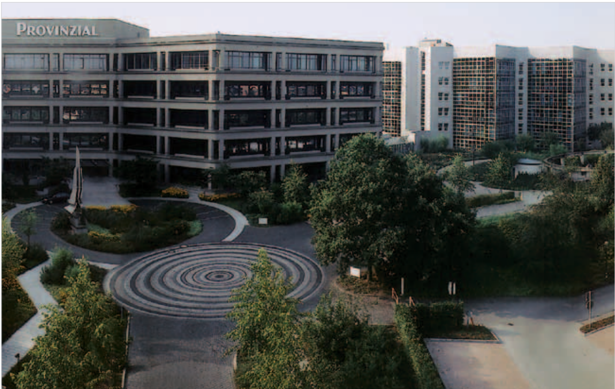
Westfälische Provinzial Versicherung AG, Münster