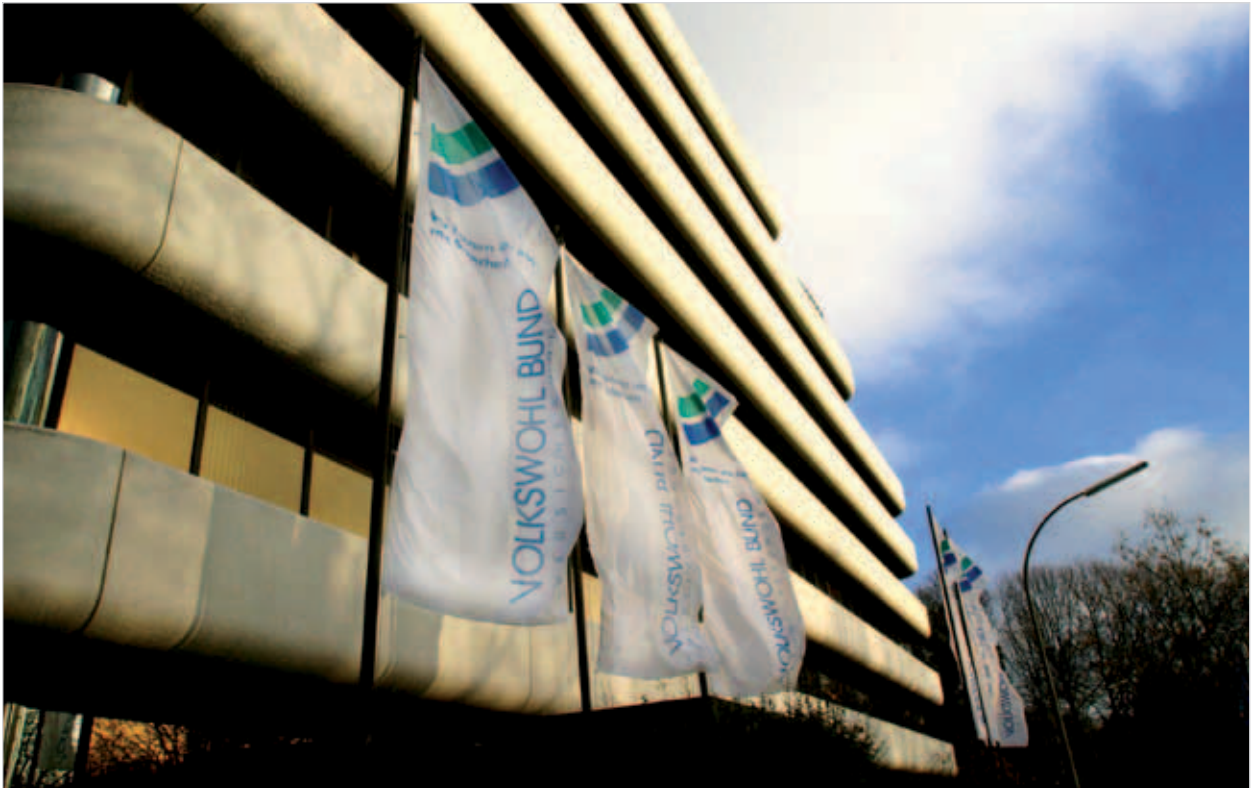
Volkswohl Bund Versicherungen, Dortmund