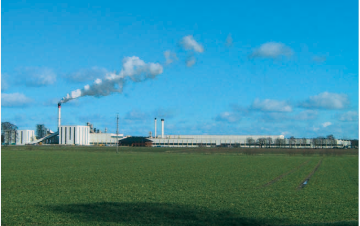
Werk Nettgau, Glunz AG

Sofern bei einer geplanten Gewerbe-/Industrieansiedlung die Standortwahl gefallen ist bzw. im kommunalen Bereich eine Investitionsmaßnahme durchgeführt werden soll, strukturieren und koordinieren wir das Antragsverfahren und bereiten die Erstellung des Förderantrags vor. Hierbei werden neben den nationalen Vorgaben der Förderrichtlinien/-programme und des Haushaltsrechtes auch die europäischen Verfahrensvorschriften sowie die Notwendigkeit eines etwaigen Anmelde- und Genehmigungsverfahrens (Notifizierung) bei der EU-Kommission geprüft. Bedarf es einer Anmeldung und Genehmigung der Beihilfe durch die EU-Kommission, beraten und unterstützen wir den Beihilfeempfänger und arbeiten mit dem nationalen Zuwendungsgeber eng zusammen, um eine positive Entscheidung der EU-Kommission herbeizuführen.